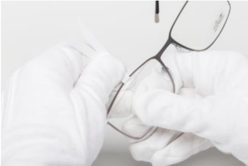
Levante o topo da armação