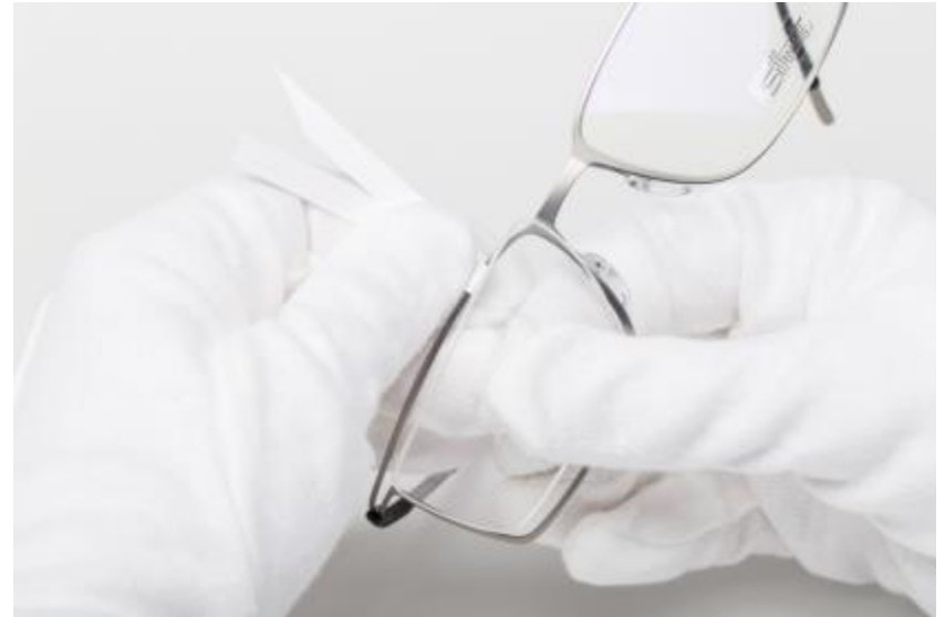
Puxe para a frente e remova a lente