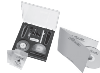
P 0033 Universal-Montage-Box universal mounting-box boite de montage universelle