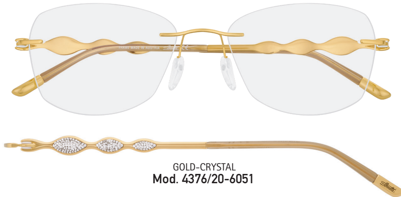
GOLD-CRYSTAL Mod. 4376/20-6051