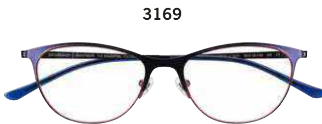
3169 c.3421 – 50/16-140 B:375