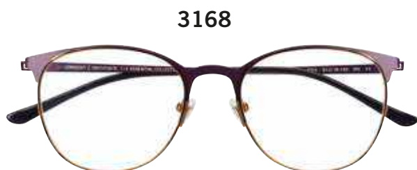
3168 c.3031 – 51/18-140 B:43