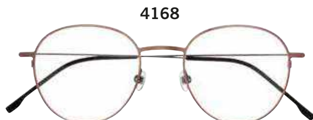
4168 c.5021 – 50/20-145 B:46