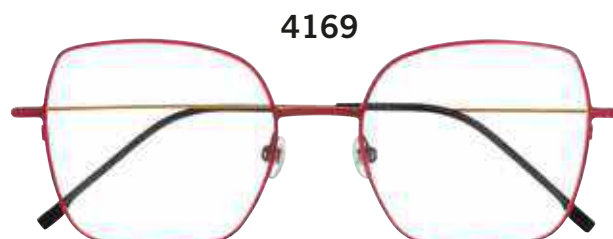
4169 c.4121 – 53/19-140 B:47