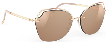
Col. / 75 3520 ROSE GOLD GLOSSY CARAMEL MIRROR