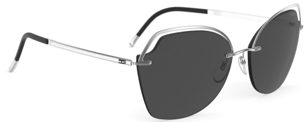
Col. / 75 7000 RHODIUM SILHOUETTE LIGHT MANAGEMENT® POL GREY