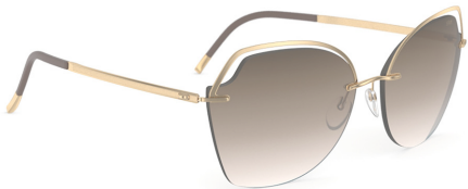
Col. / 75 7520 GOLD CLASSIC BROWN GRADIENT