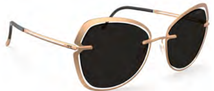
Col. / 75 3620 ROSE GOLD SILHOUETTE LIGHT MANAGEMENT® POL GREY