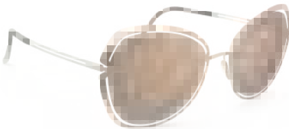
Col. / 75 3520 ROSE GOLD GLOSSY CARAMEL MIRROR