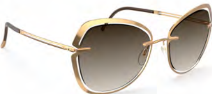
Col. / 75 7520 GOLD CLASSIC BROWN GRADIENT