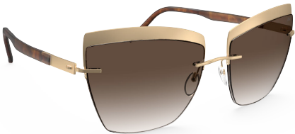
Col. / 75 7530 GOLD / VINTAGE HAVANNA CLASSIC BROWN GRADIENT