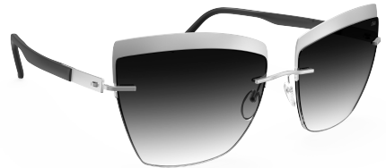
Col. / 75 7000 RUTHENIUM / BLACK CLASSIC GREY GRADIENT