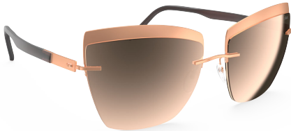
Col. / 75 3530 ROSEGOLD / BROWN GLOSSY CARAMEL MIRROR