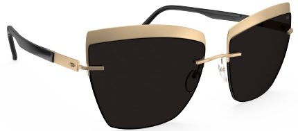
Col. / 75 7630 GOLD / BLACK SILHOUETTE LIGHT MANAGEMENT® GREY