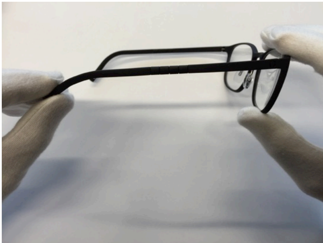
Endireite o fim da haste aos poucos.