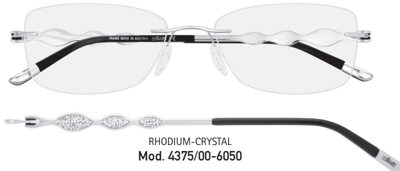
RHODIUM-CRYSTAL Mod. 4375/00-6050