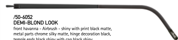
/50-6052 DEMI-BLOND LOOK front havanna - Airbrush - shiny with print black matte, metal parts chrome silky matte, hinge decoration black, temple ends black shiny with cap black shiny