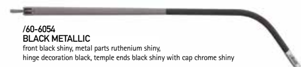
/60-6054 BLACK METALLIC front black shiny, metal parts ruthenium shiny, hinge decoration black, temple ends black shiny with cap chrome shiny