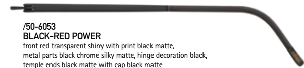
/50-6053 BLACK-RED POWER front red transparent shiny with print black matte, metal parts black chrome silky matte, hinge decoration black, temple ends black matte with cap black matte