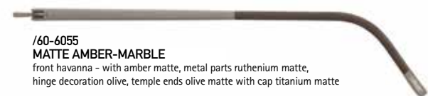
/60-6055 MATTE AMBER-MARBLE front havanna - with amber matte, metal parts ruthenium matte, hinge decoration olive, temple ends olive matte with cap titanium matte