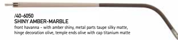
/40-6050 SHINY AMBER-MARBLE front havanna - with amber shiny, metal parts taupe silky matte, hinge decoration olive, temple ends olive with cap titanium matte