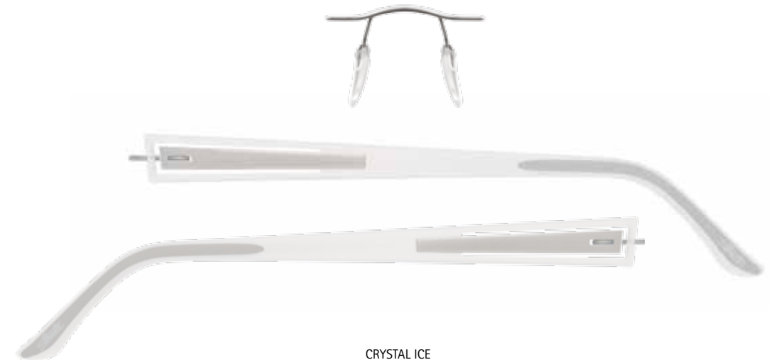
CRYSTAL ICE 5231/10-6050 Metallgarnitur aus High-Tech Titan mit SPX-Bügel Metal chassis made of High-Tech Titanium with SPX temples Kit en métal en High-Tech Titanium avec branches en SPX