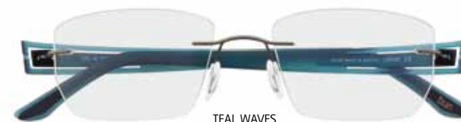
TEAL WAVES Mod. 5256/60-6057