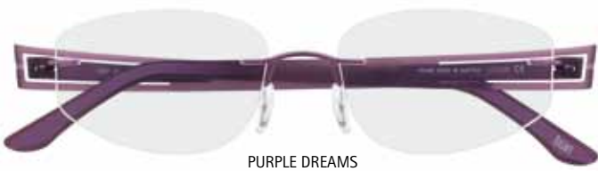
PURPLE DREAMS Mod. 4297/40-6052