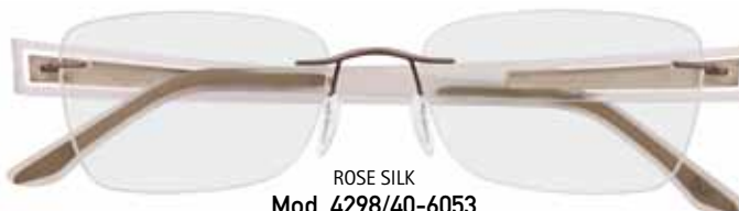
ROSE SILK Mod. 4298/40-6053