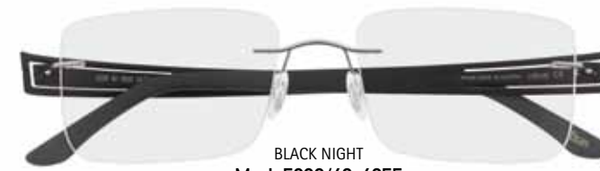
BLACK NIGHT Mod. 5228/60-6055