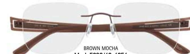
BROWN MOCHA Mod. 5230/40-6054