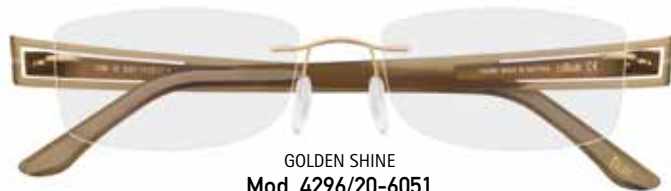
GOLDEN SHINE Mod. 4296/20-6051