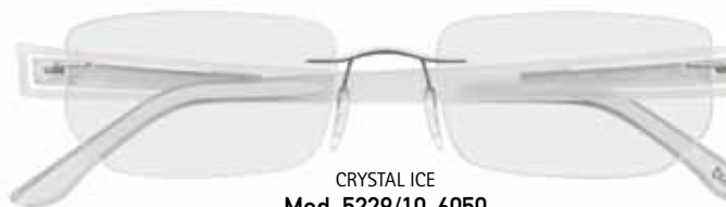
CRYSTAL ICE Mod. 5229/10-6050