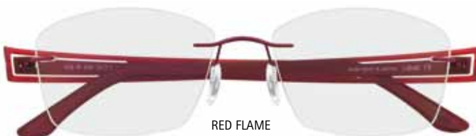
RED FLAME Mod. 4338/40-6056