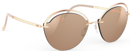
Col. / 75 3520 ROSE GOLD GLOSSY CARAMEL MIRROR