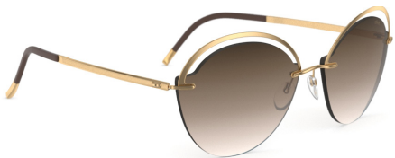
Col. / 75 7520 GOLD CLASSIC BROWN GRADIENT