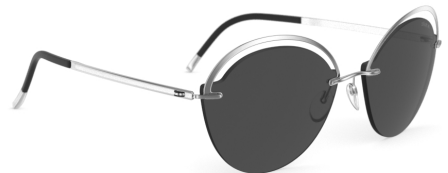
Col. / 75 7000 RHODIUM SILHOUETTE LIGHT MANAGEMENT® POL GREY