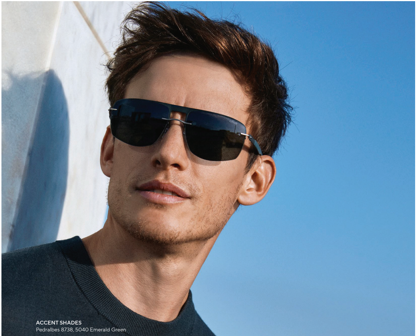
ACCENT SHADES Pedalbes 8738, 5040 Emerald Green