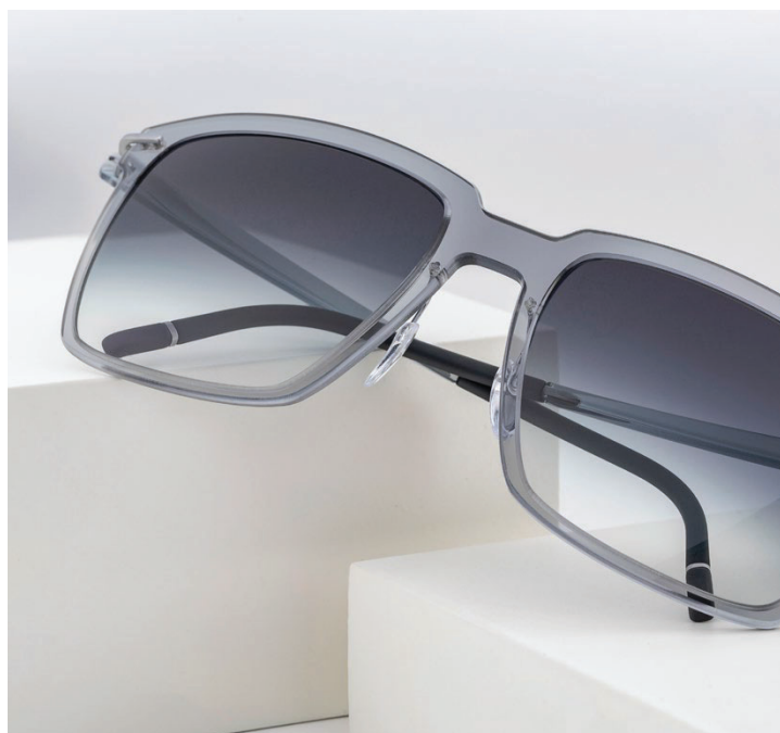
MENTON 4082, 6510 GREY BLUE 1:1 PRESCRIPTION LENSES | HIGH-TECH TITANIUM / SPX®+

Com a sua ponte superior marcante e ângulos modernos, esta interpretação contemporânea do estilo Wayfarer tem todos os elementos para se tornar um clássico moderno. Disponível em gradientes de cinza, azul, castanho e preto, faz referência ao espírito de escapismo da região da Riviera, conhecida pelas suas grandes mansões, jardins e praias.