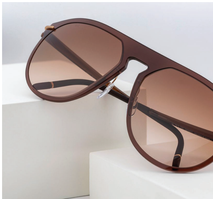
ANTIBES 4083, 6130 SIMPLY BROWN 1:1 PRESCRIPTION LENSES | HIGH-TECH TITANIUM / SPX®+ SILHOUETTE LIGHT MANAGEMENT®