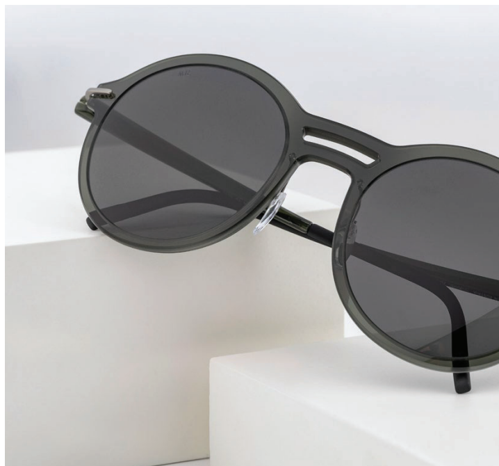
MOUGINS 4084, 5510 FRESH GREEN 1:1 PRESCRIPTION LENSES | HIGH-TECH TITANIUM / SPX®+ POLARIZED FILTER