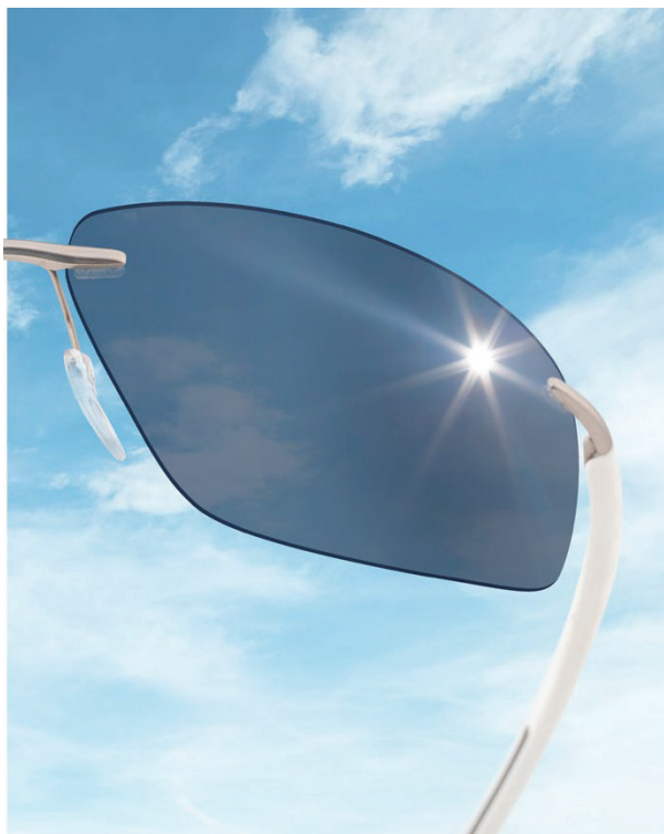
STREAMLINE COLLECTION Biscayne Bay 8727, 7110 White / Cool Grey